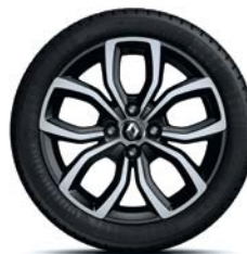
RDIF30 Jante de aliaj 16" "PULSIZE" negre diamantate (standard pe versiunea INTENS)