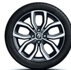
RDIF31 Jante de aliaj 16" "PULSIZE" gri diamantate