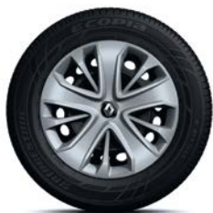
RDIF24 Jante din oțel de 15" cu capace "LAGOON" (standard pe versiunea LIFE)