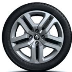
RDIF28 Jante Flex Wheel 16" "ATTRACTIVE" (standard pe versiunea ZEN)