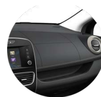
PERA09 (Negru - Standard)

■ Pachet personalizare interioară Roșu / Ivoire / Gri: